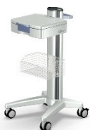
Gerätewagen EPRO Mit Schublade, Korb, Doppellenkrollen Artikel-Nr. EPRO