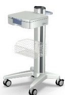
Gerätewagen EPRO Mit Schublade, Korb, Doppelenkrollen Artikel-Nr. EPRO