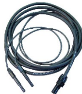
EKT-Behandlungskabel 2,5m Artikel-Nr. ECET-P