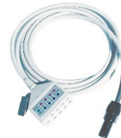
Monitor-Stammkabel 3m für EEG/EMG/EKG Artikel-Nr. ECEF-4