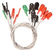
Elektrodenleitungen 61cm mit 9 Clips Artikel-Nr. ELDW-9