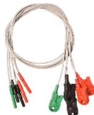
Elektrodenleitungen 61cm mit 5 Clips Artikel-Nr. ELDW-5