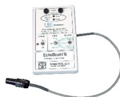
Ectobrain II EKT-Simulator und Tester Artikel-Nr. ECTOB