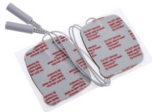
Thymapad EKT-Behandlungselektroden Artikel-Nr. EPAD-C