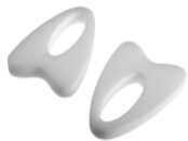
BiteGuard Einweg-Mundschutz, einzeln verpackt Artikel-Nr. BIGU-SC